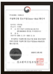
기술혁신형 중소기업 확인서